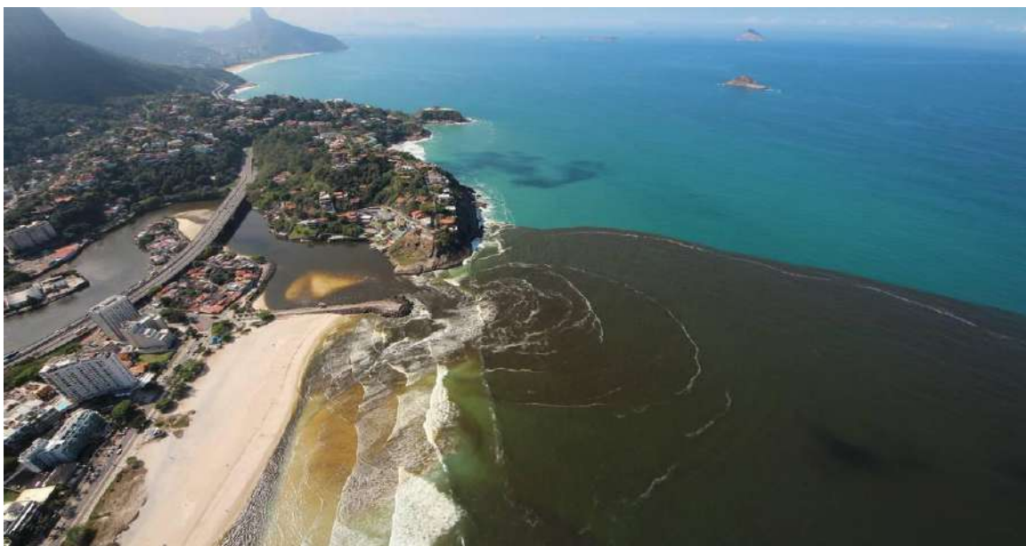
Figura 2 - Quebra-mar da Barra da Tijuca.