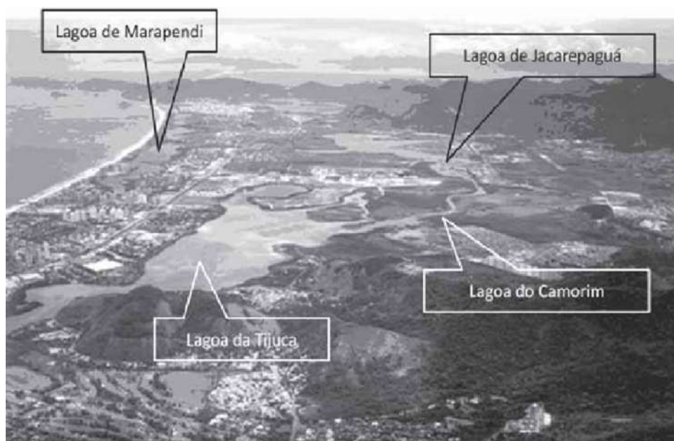
Figura 1 - Mapa da região hidrográfica do Complexo Lagunar de Jacarepaguá.