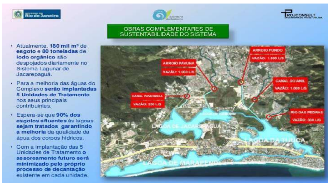
Figura 4 – Estações de Tratamento das Lagoas de Jacarepaguá.

Ainda de acordo com o INEA, (2020), segundo padrões do CONAMA (Conselho Nacional do Meio Ambiente), as lagoas da Baixada de Jacarepaguá são da classe 2 (águas salobras e doces), e os rios que contribuem para esta bacia hidrográfica também pertencem à mesma classe. Segundo o boletim INEA, 2019, as condições da água desta região são bem abaixo do desejado. Sabe-se que o processo de degradação se torna cada vez mais acelerado, em função de construções já acabadas e em construção, hotéis e condomínios. Além das gigantescas comunidades que crescem a cada dia, grilagem de terras e a falta de saneamento na região. Nesse cenário caótico, o Poder Público limita-se a emitir boletins com conclusões já conhecidas, porém sem propostas e principalmente atuação eficaz para reversão do quadro instalado. Na figura 4, é mostrado o local onde seriam implantadas futuras estações de tratamentos de esgotos.