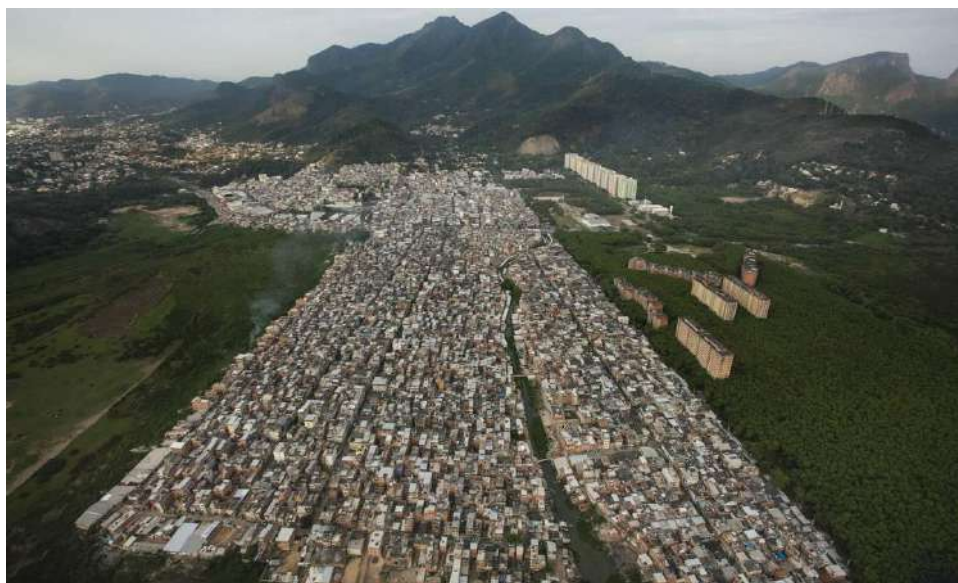
Figura 3 – Avanço da favela Rio das Pedras sobre a Lagoa de Marapendi.