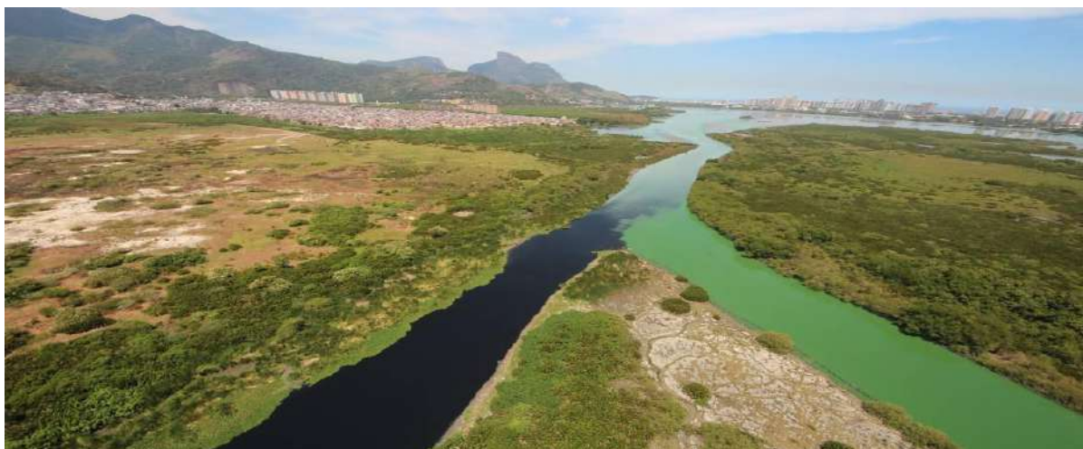
Figura 5 – Rio Arroio Fundo 100% de esgoto lançado na lagoa de Marapendi